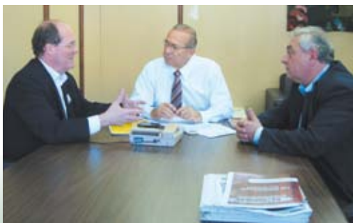
Dep. Federal Eliseu Padilha trata sobre o Piso Salarial dos Técnicos Industriais e Agrícolas.

O V Encontro Estadual dos Técnicos Agrícolas da SEAPPA será realizado na EXPOINTER, no dia 4 de setembro, às 14h.