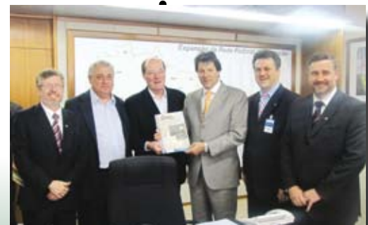
Ministro da Educação, Fernando Haddad, recebeu os Técnicos Agrícolas e Industriais.

Assembleia Legislativa homenageia Sintargs com Medalha da 52ª Legislatura