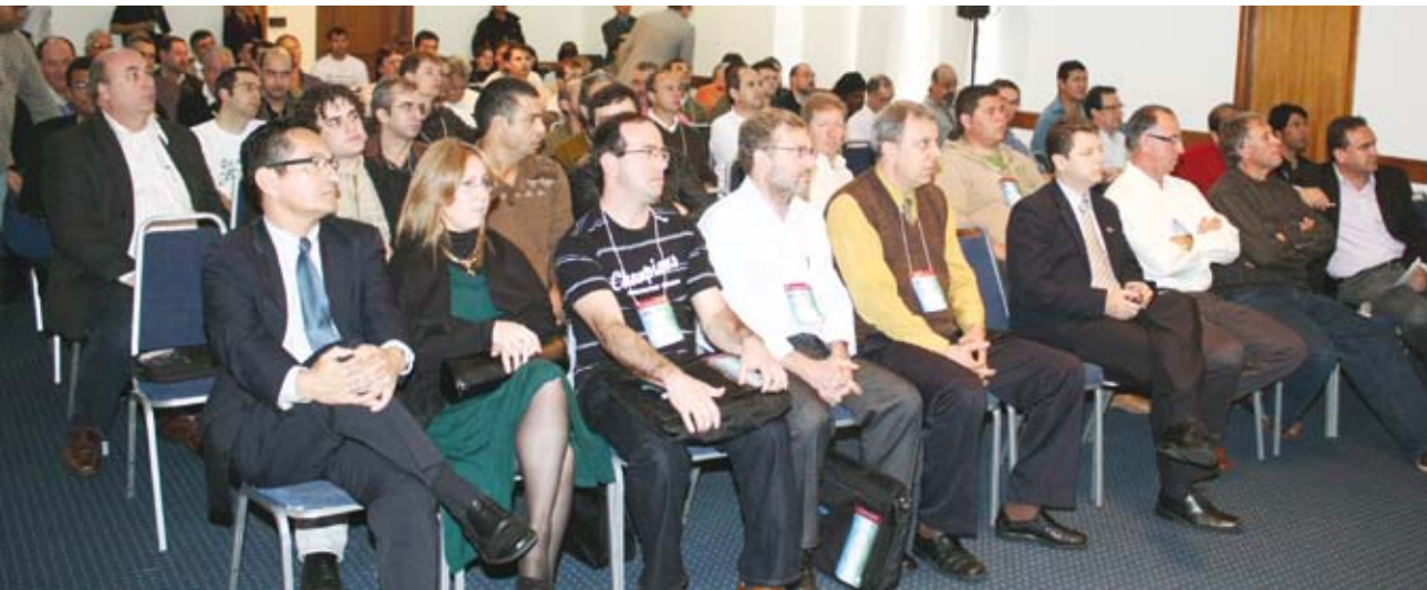
Mais de duzentos Técnicos Agrícolas e Industriais participaram do 1º Encontro Estadual de Integração em Porto Alegre/RS.

O V Encontro Estadual dos Técnicos Agrícolas da SEAPPA será realizado na EXPOINTER, no dia 4 de setembro, às 14h.